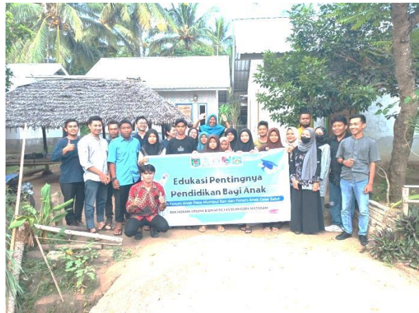
Gambar 2. Sosialisasi Pentingnya Pendidikan Pada Forum Anak Desa Mumbulsari dan Desa Salut

Kegiatan pengabdian masyarakat ini sangat penting sebagai alat untuk menyebarkan pengetahuan yang sesuai dengan kebutuhan masyarakat, terutama dalam konteks Pendidikan (Nurgiansah, 2020). Desa Mumbulsari dan Desa Salut, yang terletak di Provinsi Lombok Utara, adalah dua desa yang kini membutuhkan upaya sosialisasi yang lebih aktif mengenai pentingnya pendidikan bagi anak-anak, remaja, dan pemuda mereka. Sosialisasi ini bertujuan untuk mendorong komitmen anak-anak tersebut dalam mengejar pendidikan hingga tingkat SMA, sehingga mereka dapat menghindari perilaku negatif seperti perundungan terhadap teman sebaya dan bahkan pernikahan dini, yang seringkali disebabkan oleh pergaulan bebas dan kurangnya pendidikan formal (Sahroni, 2017).