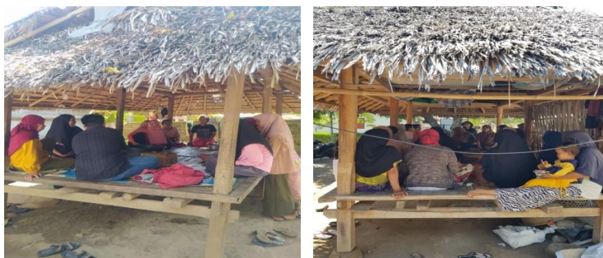
Gambar 2. Foto dokumentasi pengabdian