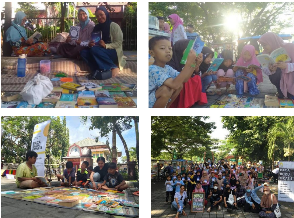
Gambar 2. Foto dokumentasi pengabdian