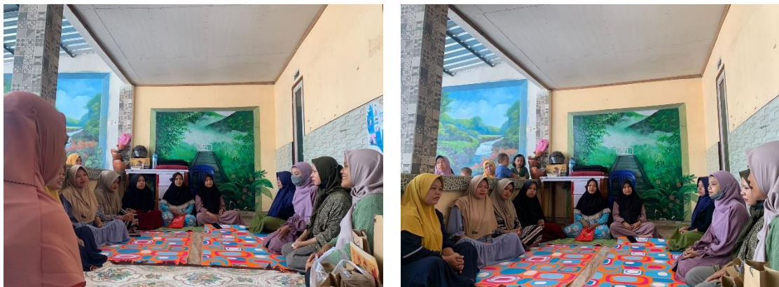
Gambar 2. Foto dokumentasi pengabdian

Akibatnya, terlalu banyak anak-anak yang lebih mementingkan uang saku untuk digunakan jajan dibandingkan disisihkan dalam menabung. Kondisi tersebut tentunya berpengaruh terhadap tingkat pengetahuan anak-anak mengenai menabung dan cara mengelola uang sangat rendah (Palimbong et al., 2022). Untuk mengatasi kondisi tersebut tentunya diperlukan peran orang tua untuk mengajarkan dan memotivasi kepada anak-anak bahwa pentingnya pengelolaan keuangan. Meskipun masih ada orang tua yang tidak peduli terhadap pengenalan literasi keuangan pada anak-anaknya, namun sebagian orang tua juga telah memahami dan memberikan literasi keuangan sejak dini pada anak-anaknya. Sebagai contoh, para orang tua mengajarkan untuk mengutamakan menabung daripada menghabiskan uang jajan seperti membeli mainan dan makanan ringan. Peran orang tua seperti itu sangat dibutuhkan agar dapat memantau anak-anaknya dalam mengelola keuangan, dengan harapan bahwa mereka akan terbiasa untuk menyisihkan sebagian uangnya serta mampu menentukan antara kebutuhan dan keinginan dalam mengelola keuangannya.