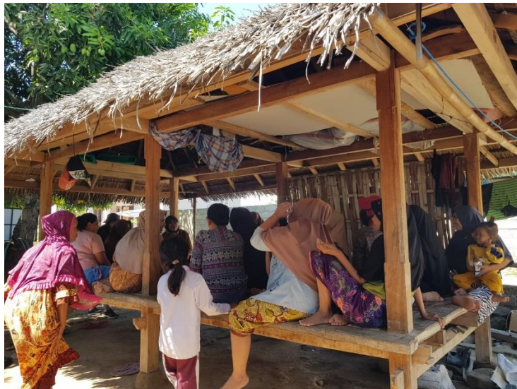
Gambar 4. Pendampingan dan Monitoring Peserta dalam Kegiatan Pengabdian

Tahap implementasi dengan melakukan pendampingan dan monitoring peserta dalam kegiatan pengabdian seperti pada Gambar 4. Warga mendengarkan seksama materi mengenai Penguatan Pendidikan Karakter Pada Orang Tua Guna Meminimalisir Kenakalan Remaja Pada Anakyang telah disampaikan oleh tim pengabdian kepada masyarakat. Pemantauan kegiatan dengan menilai sikap peserta dalam kegiatan yang sangat antusias dan semangat.