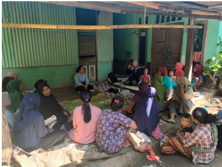
Gambar 1. Pembukaan oleh Ketua Tim Pengabdian Kepada Masyarakat

Kegiatan pengabdian kepada masyarakat yang dilakukan oleh tim Universitas Bumigora yang dilaksanakan di Dusun Salut Kendal Kabupaten Lombok Utara. Kegiatan sosialisasi pengabdian masyarakat ini bekerjasama dengan Lembaga Swadaya Masyarakat (LSM) Yayasan Seleksa Sejahtera Mataram seperti pada Gambar 1. Kegiatan pelatihan dimulai dengan pembukaan oleh Ketua Tim Pengabdian kepada Masyarakat.