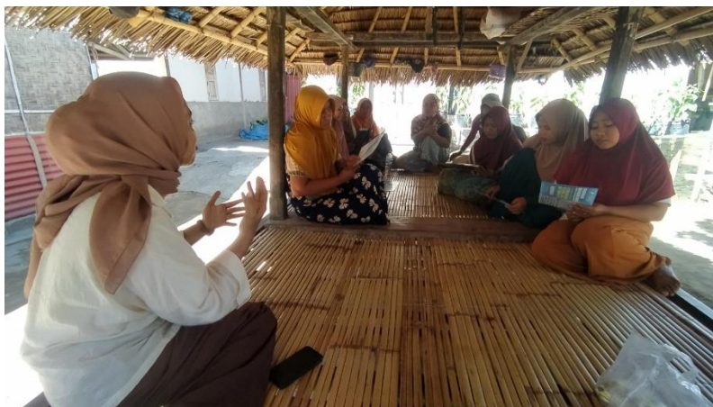
Gambar 2. Pemaparan Materi Sosialisasi

Selanjutnya pemaparan materi sosialisasi kegiatan pengabdian kepada masyarakat seperti pada Gambar 2. Kegiatan ini bertujuan untuk memberikan sosialisasi mengenai Penguatan Pendidikan Karakter Pada Orang Tua Guna Meminimalisir Kenakalan Remaja Pada Anak.