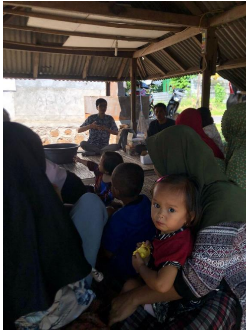
Gambar 3. Pemaparan Materi Pendidikan karakter

termasuk hal baru bagi warga dusun salut.