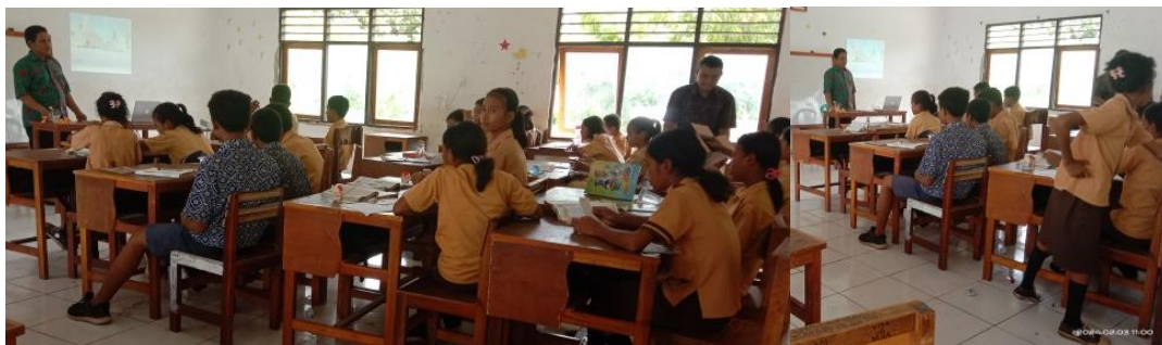
Gambar 2. Dokumentasi Pengabdian

Pada tahap evaluasi pemateri memberikan soal latihan kepada peserta didik untuk dikerjakan, soal yang diberikan berbeda dari soal yang ada pada materi atau hanya berbeda angka hasilnya 90% dari total siswa dapat menyelesaikan soal yang diberikan. Soal tes yang diberikan berupa soal uraian yang dikerjakan secara individu. Siswa mengerjakan soal itu dengan tidak menyontek kepada peserta lainnya. Selain memberikan soal, pemateri melakukan wawancara atau diskusi kepada peserta seminar untuk mengetahui ketertarikan siswa atau peserta terhadap kegiatan seminar tentang unsur matematika yang terdapat pada rumah adat Loura. Dari wawancara, pemateri memperoleh informasi bahwa siswa sangat senang dengan adanya kegiatan seminar ini semoga bisa diadakan lagi pada waktu yang akan datang. Menurut beberapa siswa kegiatan ini meningkatkan motivasi dalam belajar matematika karena bisa ditemukan pada budaya.