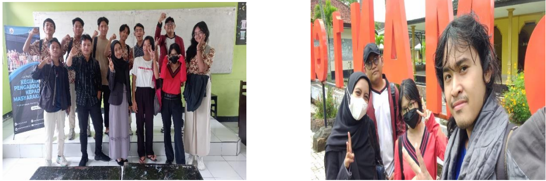
Gambar 3. Foto dokumentasi akhir pengabdian