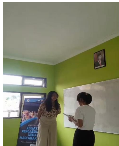
Gambar 2. Foto dokumentasi pengabdian