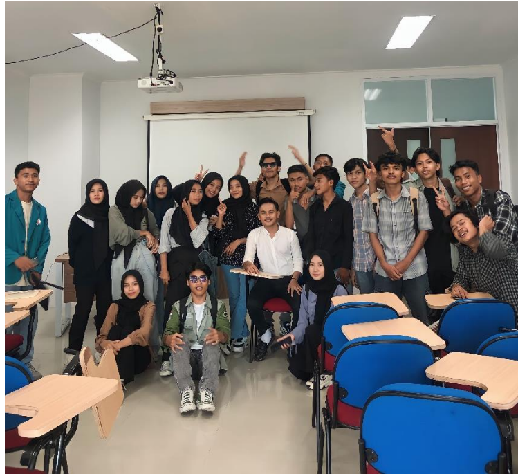
Gambar 2 : Foto Bersama setelah sesi Tanya jawab

alam, kapasitas infrastruktur, kebutuhan dan ikut serta dalam menjaga lingkungan. Pelatihan mengenai Effective Carrying Capacity bertujuan untuk memberikan pemahaman lebih dalam kepada mahasiswa dengan pengetahuan dan keterampilan yang diperlukan untuk mengelola ekowisata wisata keberkelanjutan yang bertanggung jawab.