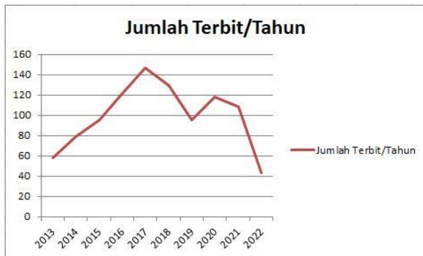
Gambar 1: grafik jumlah terbit artikel tiap tahun

Artikel dengan topik penilaian pembelajaran fisika yang diterbitkan dari tahun 2013 hingga 2022 dapat ditemukan 10 artikel teratas yang di citasi atau dikutip, yaitu: